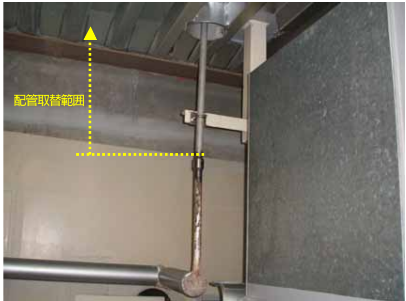
補助蒸気ドレン配管取替状況