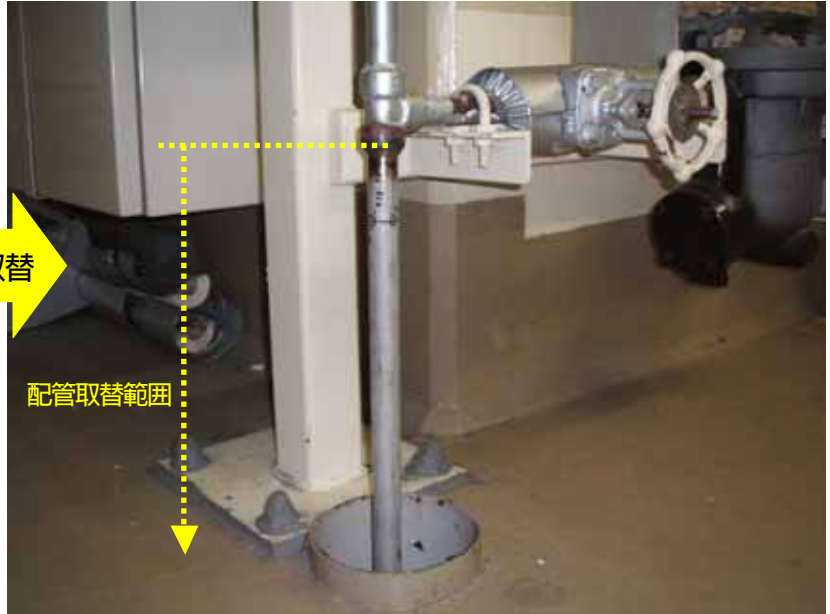
当該ドレン配管貫通穴