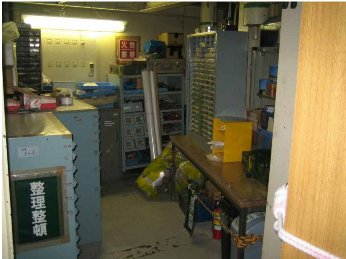
伊方1号機原子炉補助建家5階 工具庫