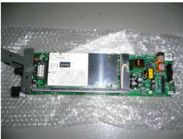
制御信号変換器(新品)