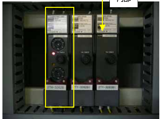
不具合のあった制御信号変換器