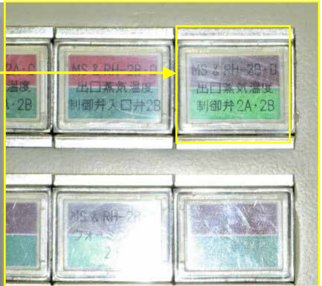
加熱蒸気制御弁開閉表示