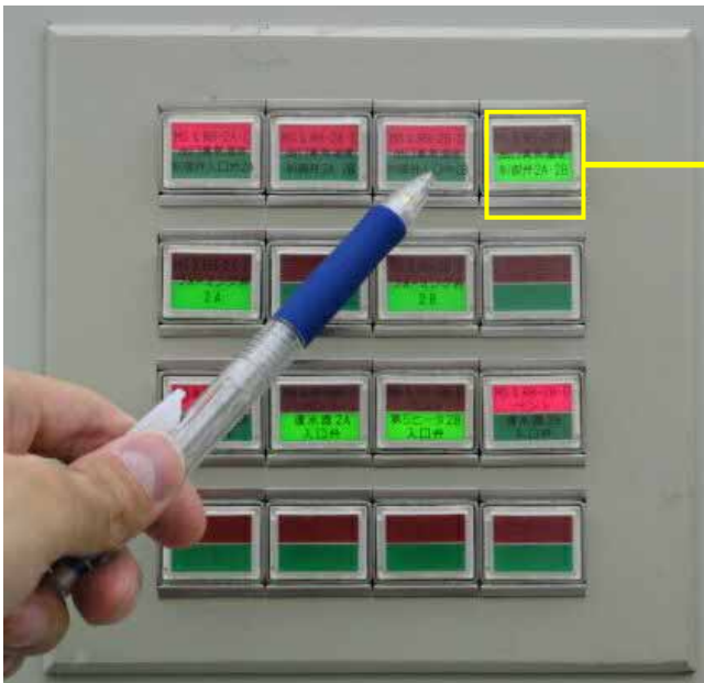
弁開閉状態表示盤(青 - 閉、赤 - 開)