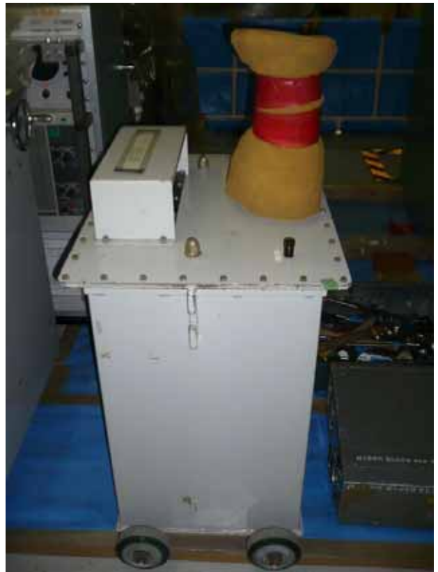
モータの耐電圧試験用機材(約400kg) (負傷した作業員が運搬していたもの) (寸法幅65cm×奥行50cm×高さ80cm)