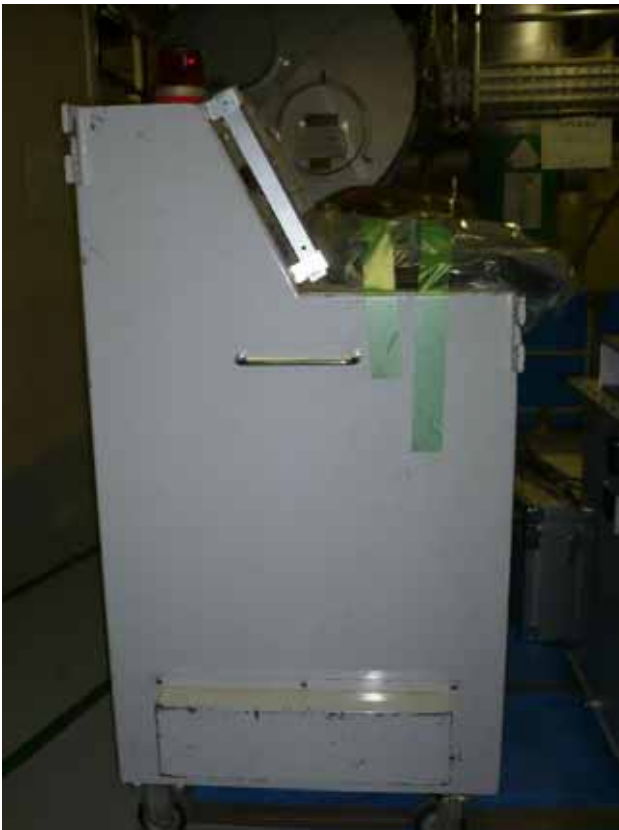
モータの耐電圧試験用機材(約300kg) (足をぶつけた機材) (寸法幅70cm×奥行70cm×高さ130cm)