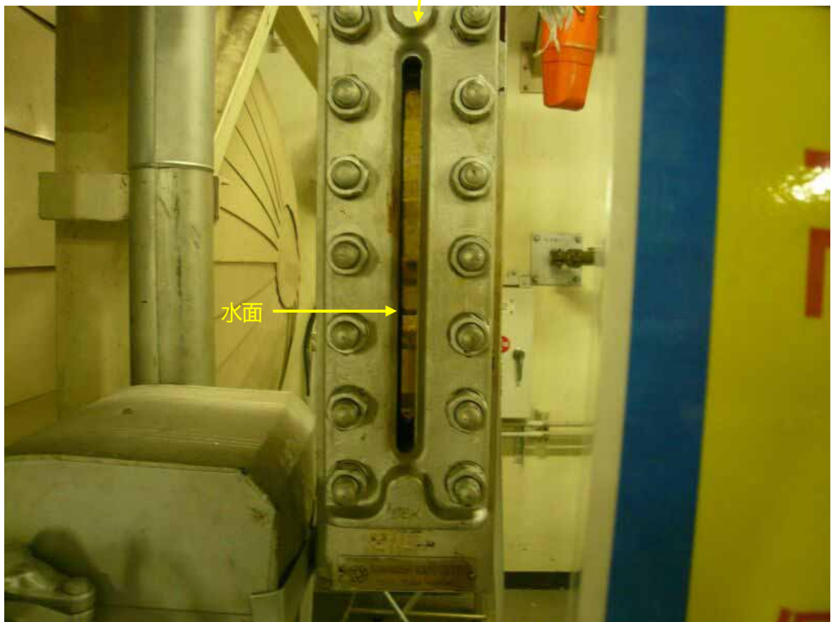
水面計復旧状況(拡大)