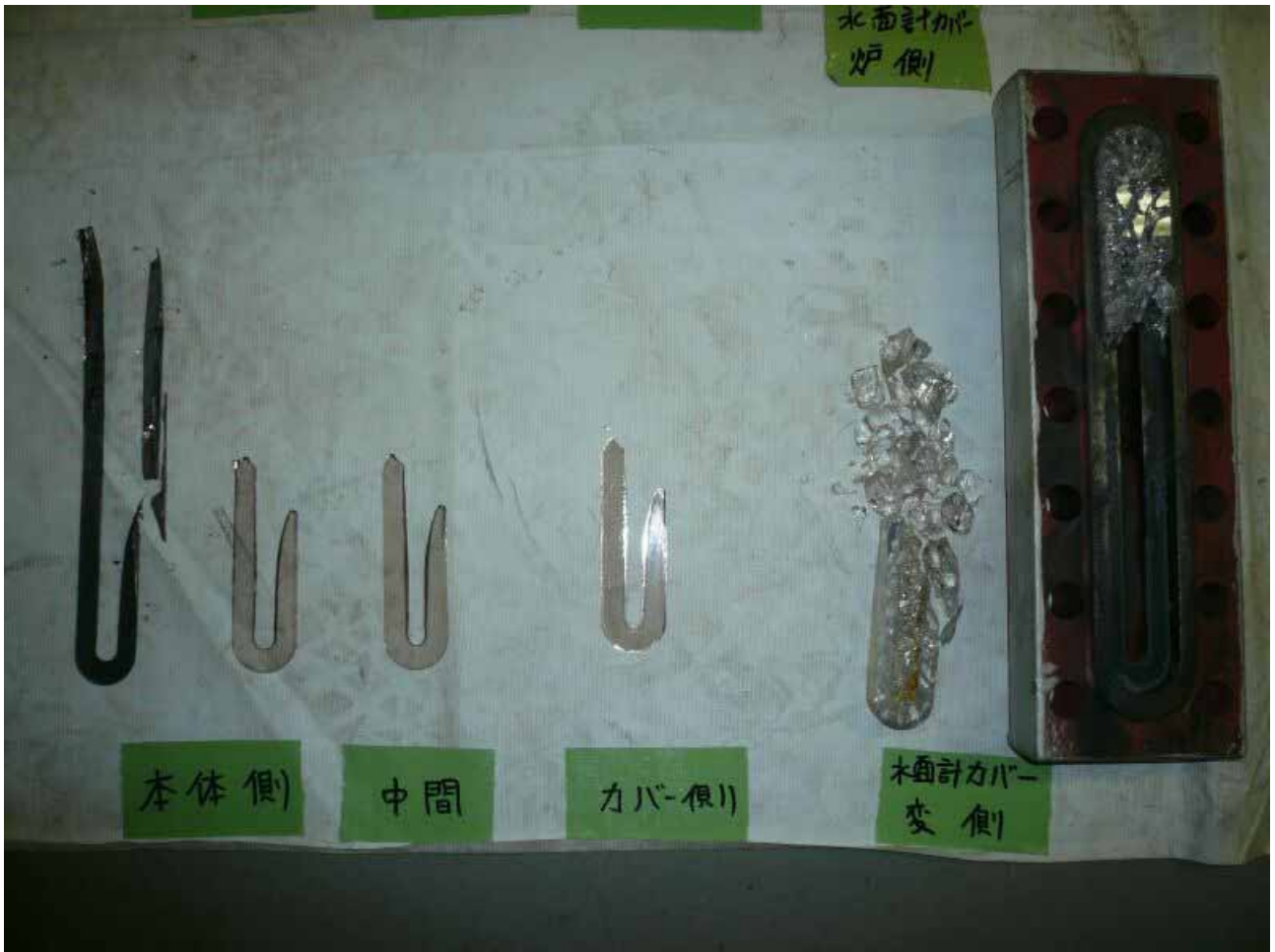
水面計のガラス及びパッキン