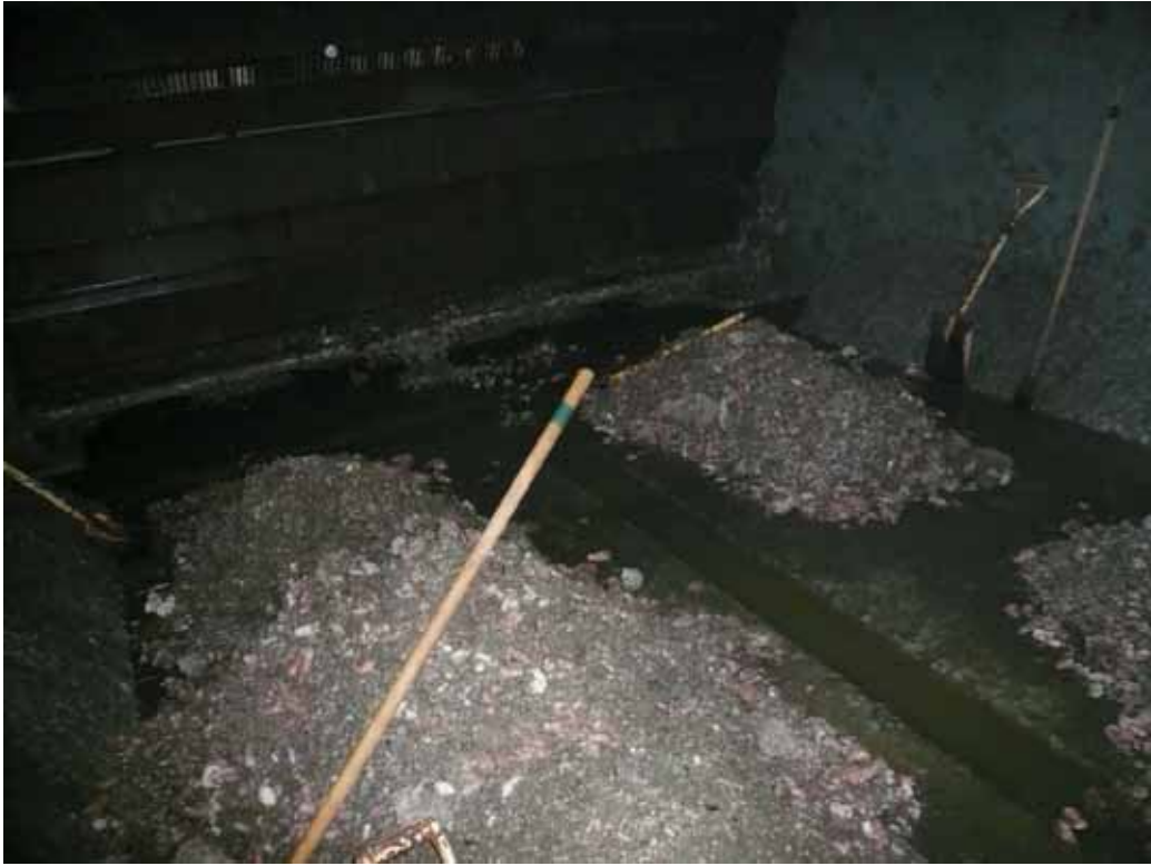
取水ピット除貝作業現場