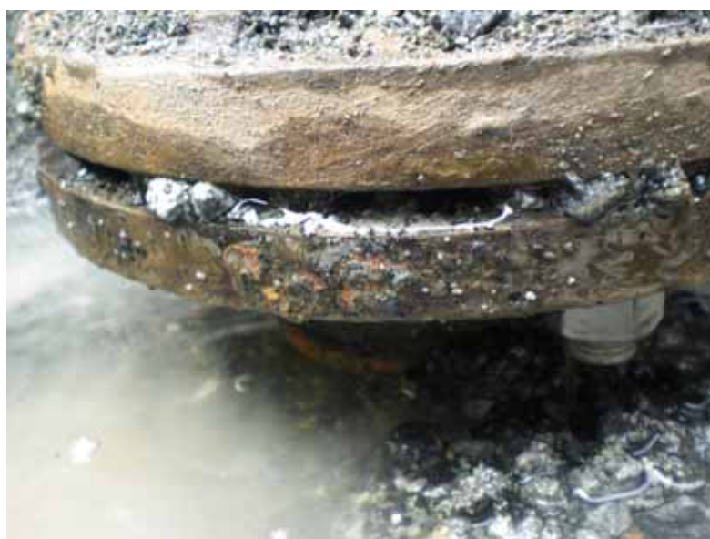
消火栓 フランジ部