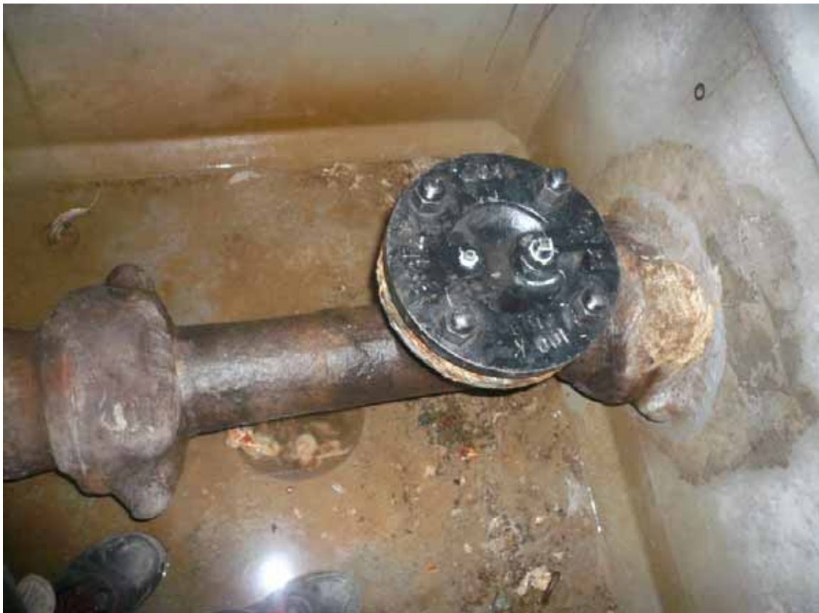
閉止フランジ取付状況