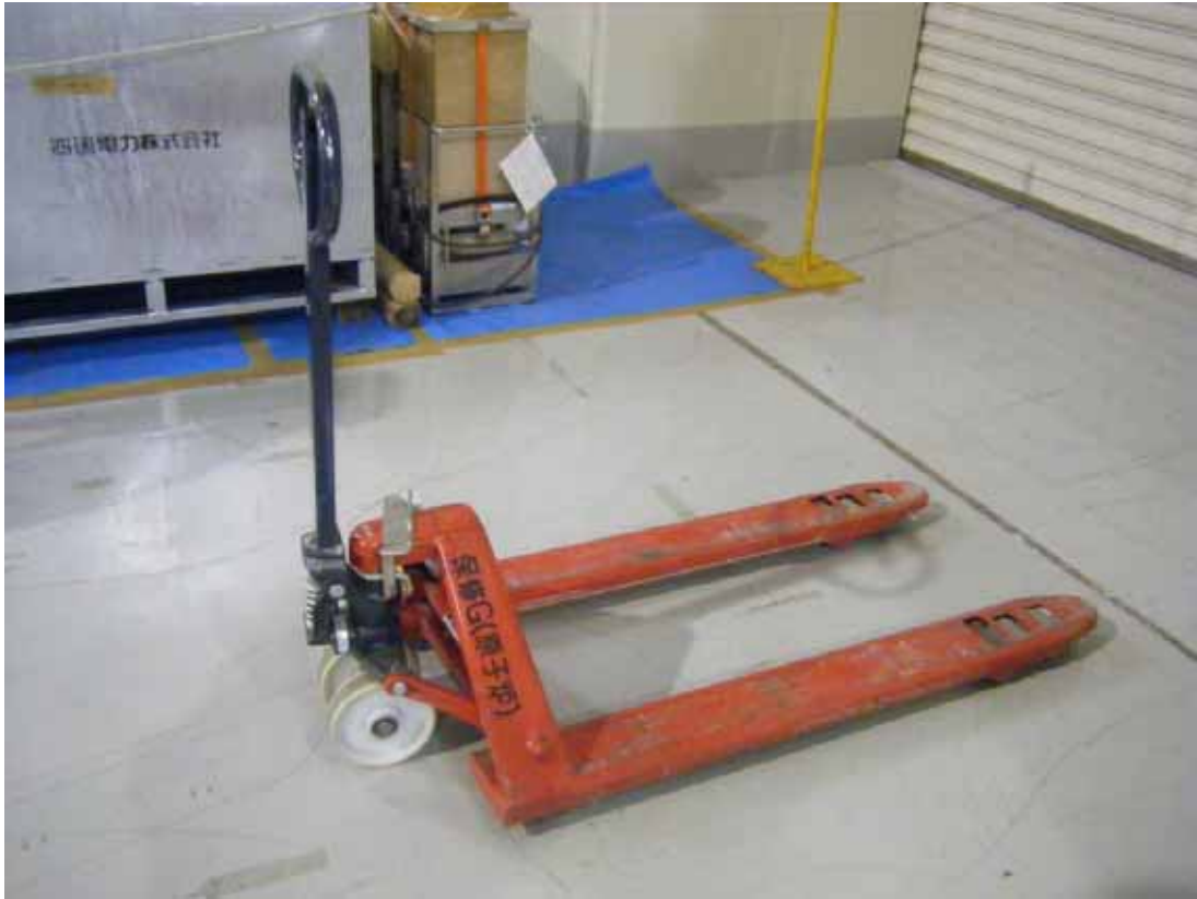
台車（ハンドリフター台車）