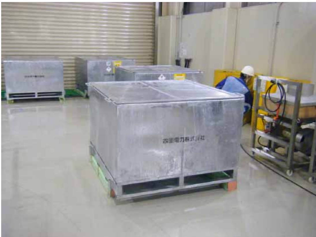
ボックスパレット（廃材（鉄くず）を運搬していた。）