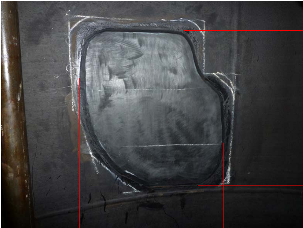
ゴムライニング保修状況