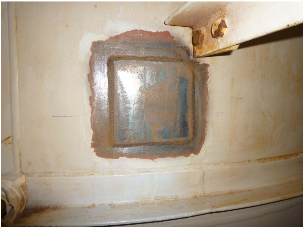
外面保修状況（胴板を溶接（約 120mm × 120mm））