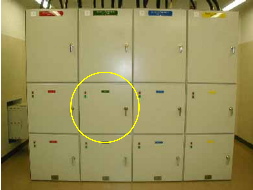
原子炉トリップ遮断器盤