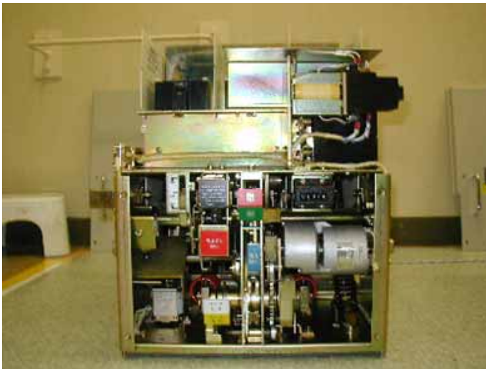
原子炉トリップ遮断器盤(予備品)