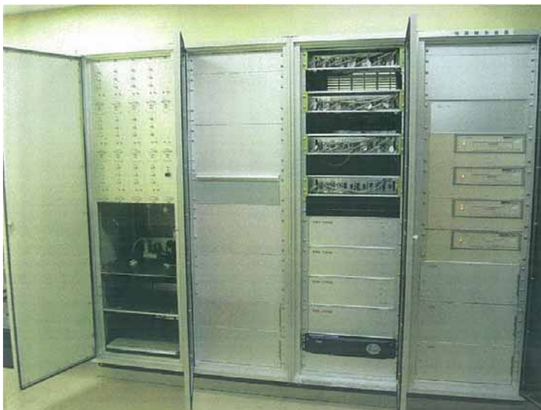
観測用地震計（測定部）