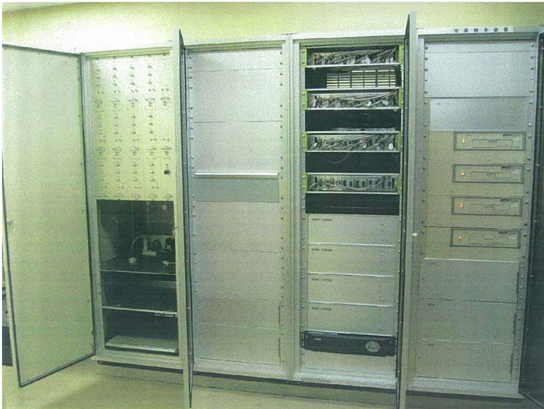
観測用地震計（測定部）