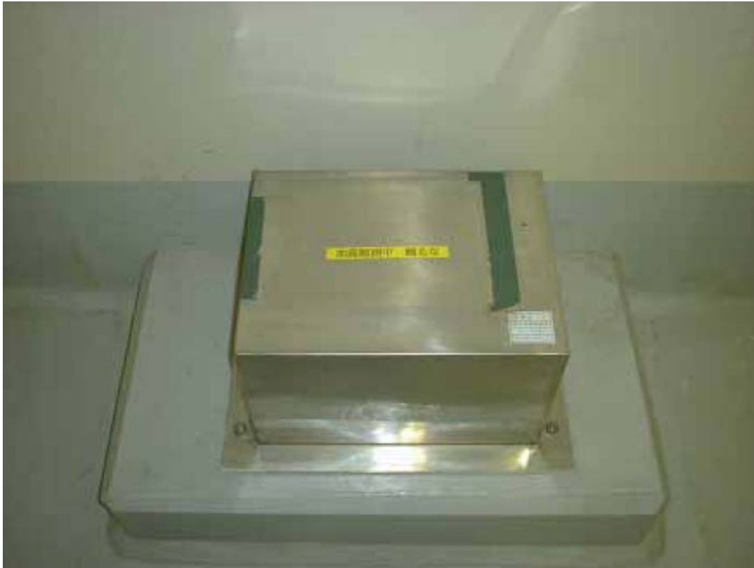
観測用地震計（検出部）