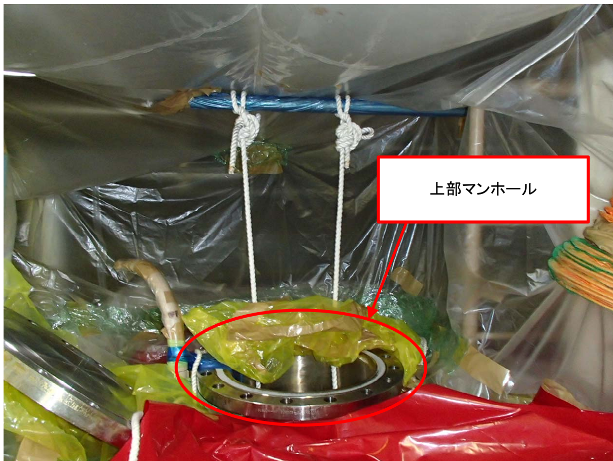
ほう酸タンク3B タンク上部の状況