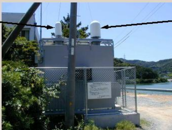
モニタリングポスト全景