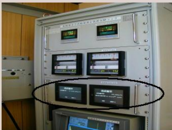
測定部 (ローカルコントローラはラックに内臓)