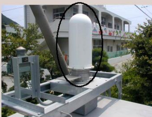
NaIシンチレーション検出器