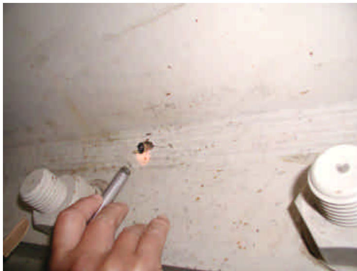
溶接部を開けた確認用の穴