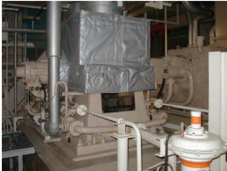
主給水ポンプ全景