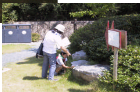
野外測定実習の様子